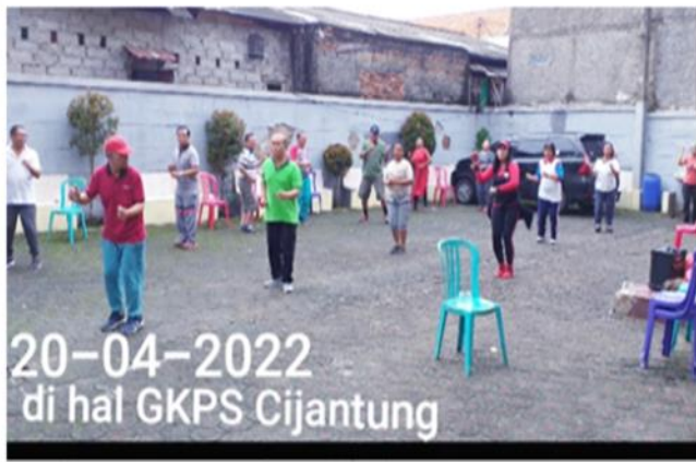
20-04-2022 di hal GKPS Cijantung