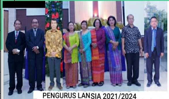
PENGURUS LANSIA 2021/2024