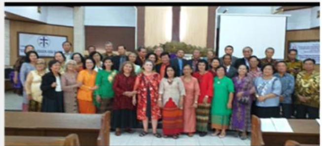
Kegiatan Natal dan bonataun LANSIA RESORT di Cijantung