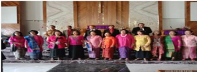
Aktif mengikuti kegiatan Resort Cikoko